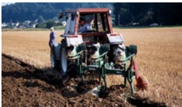
Abb. 10 Einsatz des On-land-Pfluges.

Das Vermeiden von Verdichtungen liegt im Eigeninteresse jedes Landwirts, um einerseits seine Produktionsgrundlage «Boden» zu erhalten und andererseits mit Verzicht von Lockerungseinsätzen zur Behebung von Gefügeschäden Kosten zu sparen.