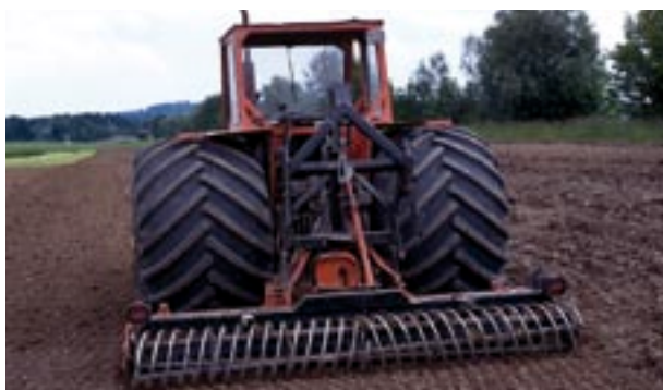
Abb. 11 Grossvolumige Reifen.