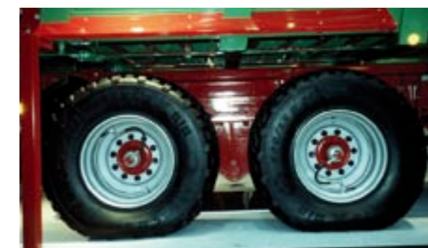
Abb. 9 Anhänger mit reduziertem Pneuinnendruck für Feldeinsatz.

Bei welchen Geräten und Maschinen sollten Reifendruckregelanlagen zum Standard gehören?