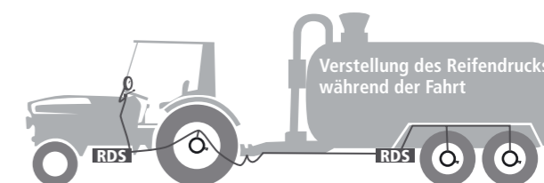
Abb. 8 Regeldrucksysteme schaffen Abhilfe! Kompromiss zwischen Feld- und Strassenfahrten.

All diese Vorteile dürfen nicht darüber hinweg täuschen, dass die Absenkung des Reifendrucks auch gewisse Grenzen hat. Z.B. bei Strassenfahrten nimmt der Verschleiss und die Gefahr der Überhitzung der Reifen mit sinkendem Luftdruck stark zu.