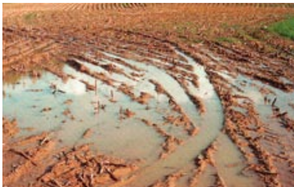
Abb.1 Stehendes Wasser: eine Folge von Bodenverdichtungen.