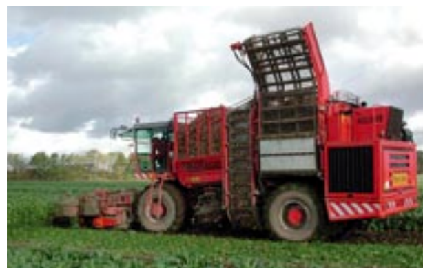
Abb. 5 Schwere Erntemaschinen erhöhen die Schlagkraft, aber auch die Gefahr der Unterbodenverdichtung.

Heute werden für alle Ackerkulturen gezogene und selbstfahrende Vollernter eingesetzt. Sie verfügen über grosse Bunker oder Tanks. Ihr Gesamtgewicht ist durchaus mit demjenigen von grossen Baumaschinen vergleichbar und kann schwerwiegende Unterbodenverdichtungen verursachen.