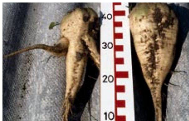
Abb.4 Beinigkeits bei der Zuckerrübe.