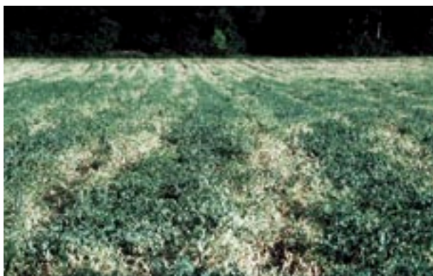
Abb.2 Ungleichmässiger Erbsenbestand aufgrund von Bodenverdichtungen.