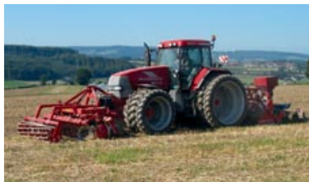
Abb. 12 Einsatz von Mehrfachbereifung und Mulchsaat.