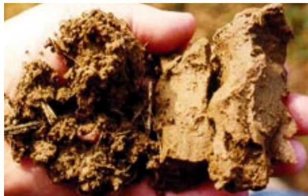
Abb.3 Vergleich von lockerem und verdichtetem Boden.